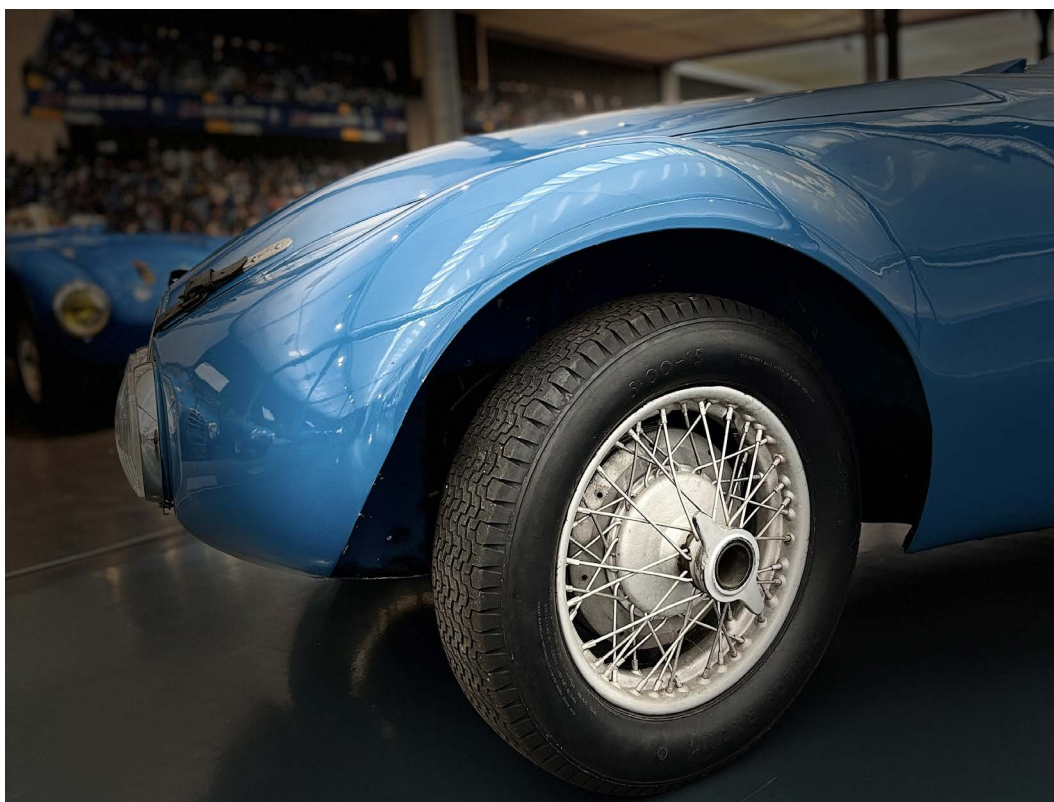
Gordini Simca 8 de 1939

La restauration du véhicule, estimée à un coût global de 41 562 € TTC, est soutenue par la Fondation du patrimoine grâce au mécénat de Motul à hauteur de 20 000 € au titre du Grand Prix Auto.