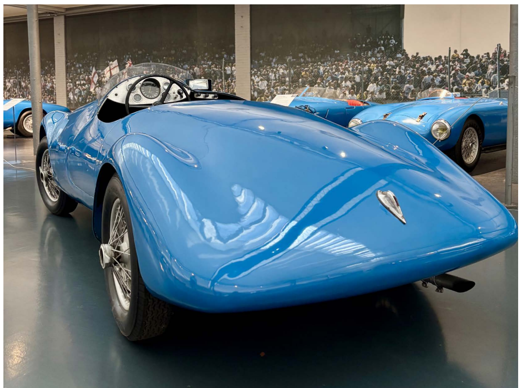
Gordini Simca 8 de 1939 © Musée national de l'Automobile de Mulhouse

À noter : le Grand Prix Auto a été présenté lors de l'avant-première du Salon Rétromobile le mardi 27 janvier et le sera durant toute la durée du salon sur le stand de la Fédération Française des Véhicules d'Époque (Bâtiment 7.2, stand C083).